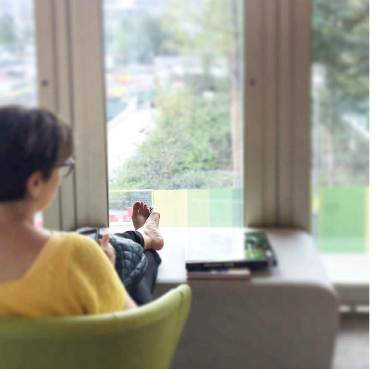
Médiathèque La Canopée - Paris